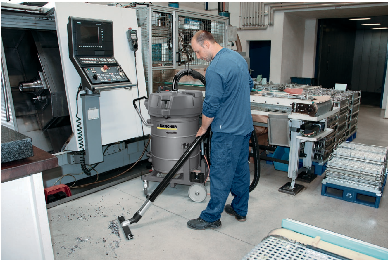
IVR-L 100/24-2 Tc